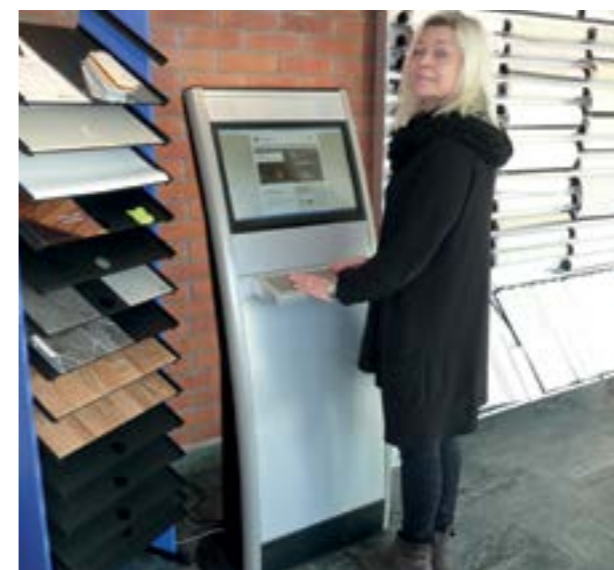
Logga in på vår kunddator

“Mina Sidor” är din personliga kundservice och verktygslåda för ditt boende och är öppen dygnet runt. Våra hyresgäster får inloggningsuppgifter och som bostads- eller bilplatssökande kan du enkelt registrera dig på vår hemsida eller kontakta Hyresbostäders kontor.