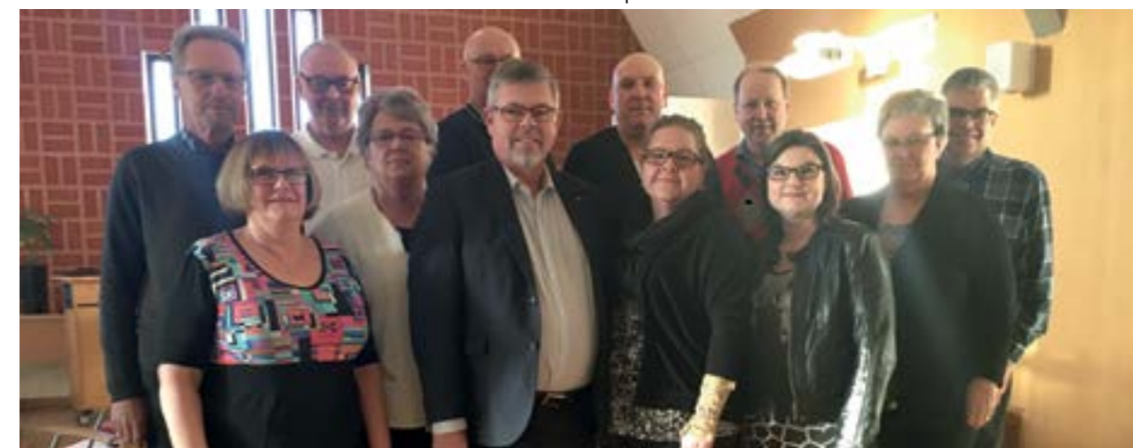
Styrelsen för Falköpings Hyresbostäder AB

Dotterbolaget Fastighets AB Mösseberg förvärvade med tillträdesdatum 1 februari 2016 samtliga aktier i Hamhus nr 16 AB med tre fastigheter med centralt läge i Falköping. Två av fastigheterna, Klockaren 7 och Klockaren 8, såldes på tillträdesdagen till Falköpings Hyresbostäder och därefter såldes bolaget till extern köpare.