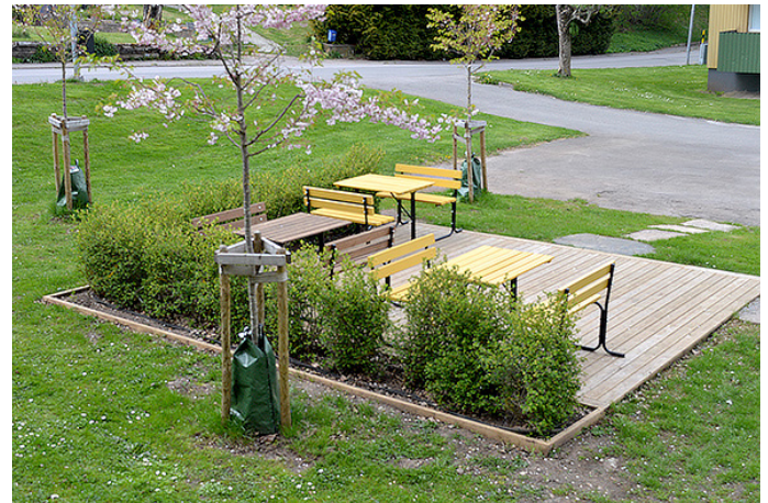
Kvarter Lindens nya grillplats